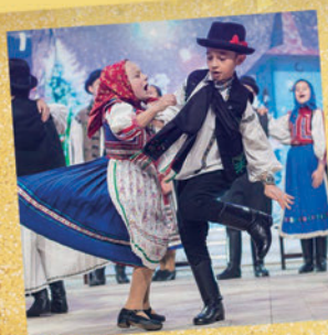
DEČIJA GRUPA FOLKLORNOG UDRUŽENJA IZ JASA, DOBITNICI PRIMA PRIMISSIMA NAGRADE I FINALISTI – „LETI PAUNE”